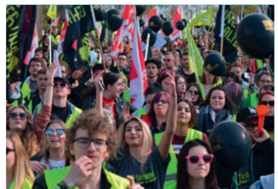
In Nürnberg gingen am 11.4.18 rund 2000 Beschäftigte auf die Straßen, darunter viele aus der verdi Jugend.