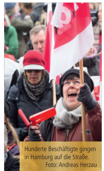
Hunderte Beschäftigte gingen in Hamburg auf die Straße.