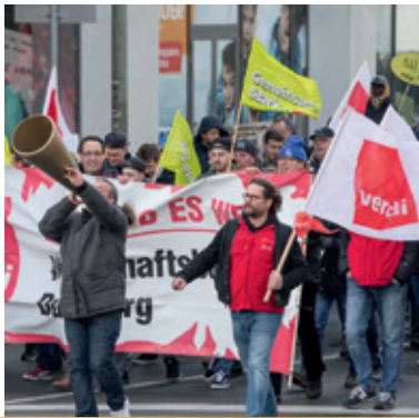
Mit mächtig viel Power wurde in Duisburg demonstriert!