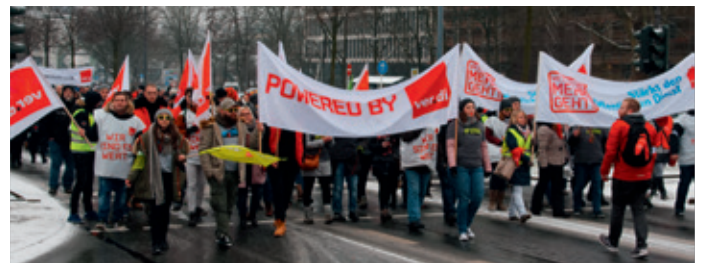
Rund 1.000 Beschäftigte demonstrierten am 20.3.18 in Wuppertal.