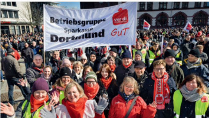
Die Beschäftigten der Sparkassen waren stets zahlreich auf den Demos vertreten – hier z.B. in Dortmund.