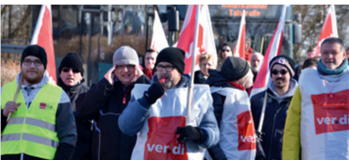
Im ganzen Saarland demonstrierten städtische Beschäftigte – hier ein Bild aus Homburg.

gruppen 2 und 9a im Bereich der handwerklichen Tätigkeiten aufgehoben. Dadurch werden in der Entgeltgruppe 2 die Stufe 6 und in der Entgeltgruppe 9a die Stufen 5 und 6 für die Beschäftigten geöffnet und es entfällt die Verlängerung der Stufenlaufzeiten in der 9a.