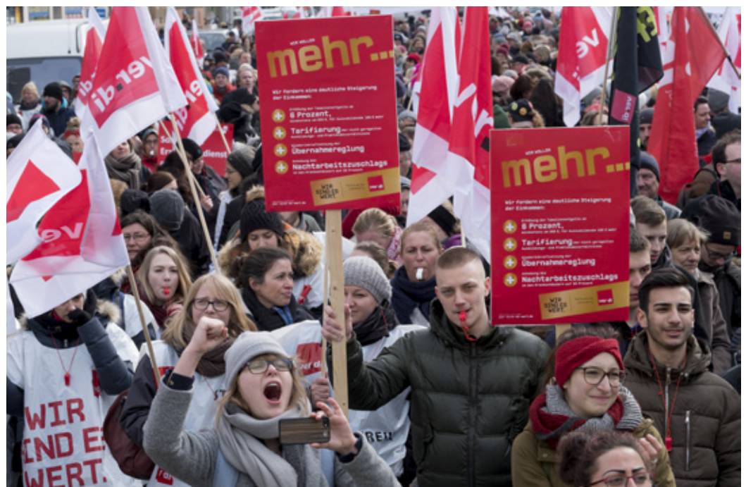
Am 22. 3. 18 legten mehr als 3.000 Beschäftigte des öffentlichen Dienstes in München ihre Arbeit nieder.