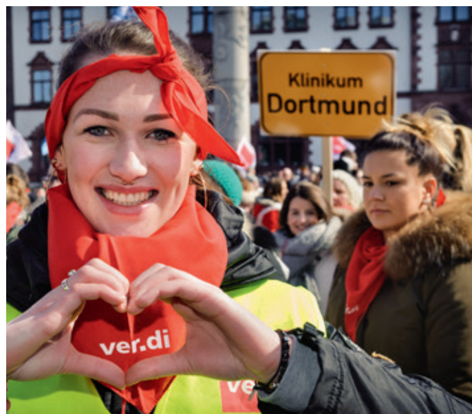
Dortmund zeigt Herz – aber mit unseren Forderungen bleiben wir hart!