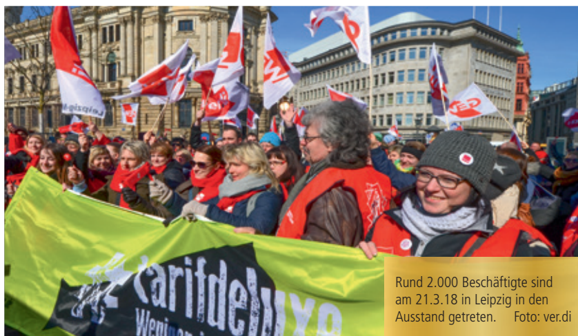
Rund 2.000 Beschäftigte sind am 21.3.18 in Leipzig in den Ausstand getreten.