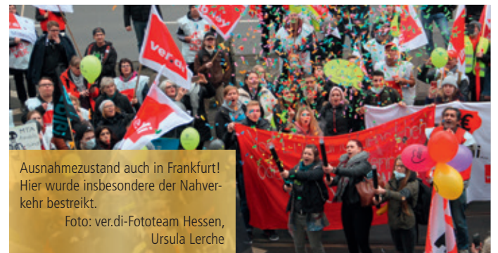
Ausnahmestand auch in Frankfurt! Hier wurde insbesondere der Nahverkehr bestreikt.

Die Schülerinnen und Schüler in der Operationstechnischen Assistenz und in der Anästhesietechnischen Assistenz sowie nach dem Notfallsanitätärsgesetz werden bereits ab dem 1. März 2018 in den Geltungsbereich des TVAÖD einbezogen. Die Schülerinnen und Schüler in praxisintegrierten Studiengängen zur Erzieherin/zum