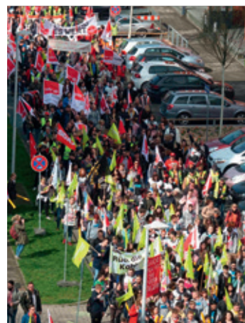
Am 11.4.18 war in Darmstadt großer Aktionstag.