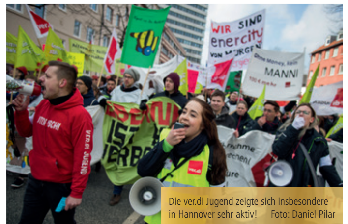
Die verdi Jugend zeigte sich insbesondere in Hannover sehr aktiv!