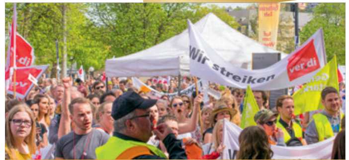
In Stuttgart streikten am 12.4.18 6.500 Beschäftigte bei frühlingshaften Temperaturen.

Nach Abschluss der Tarifrunde 2018 werden auf Spitzenebene Tarifverhandlungen zu den Regelungen bei Leistungsmin- derung aufgenommen. In diese Verhandlungen werden auch Regelungen für den Bereich der Bundeswehrfeuerwehren einbezogen.