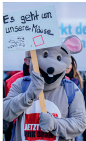
Insgesamt 3.000 Beschäftigte waren in Kiel mobilisiert und zogen vom Gewerkschaftshaus zum Rathaus.

„Das ist das beste Tarifiergebnis seit vielen Jahren! Da wo der öffentliche Dienst die größten Personalgewinnungsprobleme hat, konnten besonders hohe Zuwächse vereinbart werden. Zugleich ist es gelungen auch für die Beschäftigten in den unteren und mittleren Entgeltgruppen einen deutlichen Sprung nach oben zu sichern. Dies erhöht die Attraktivität des öffentlichen Dienstes als Arbeitgeber.“